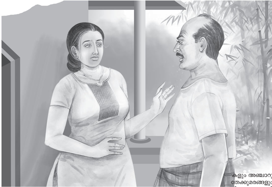
കളും അഞ്ചാറു തേക്കുമരങ്ങളും

അപ്പനെ മക്കളും അമ്മച്ചിയും ഇപ്പപ്പൻ എന്നാണു വിളിക്കാറുള്ളത്. തന്നെക്കൊണ്ട് മാത്തുപ്പാപ്പൻ ഒരു കത്തഴുതിച്ചു. കാർണം,