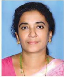
സിബി ജെ ടോ