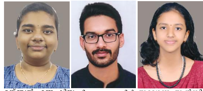
എയ്ഞ്ചൽ ഹന ഷിനു ലിജോ അഗസ്റ്റിൻ അലോണ ആൽബി