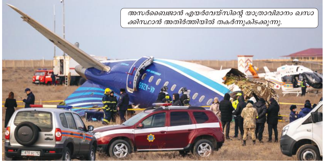
അസർബൈജാൻ എയർവേയ്സിന്റെ യാത്രാവിമാനം ഖസാക്കിസ്ഥാൻ അതിർത്തിയിൽ തകർന്നുകിടക്കുന്നു.

ഗ്രോസ്നിയിൽ യുക്രെയ്ൻ ഡ്രോണുകളുടെ നിരന്തരമായ ആക്രമണമുണ്ടായിരുന്നു. റഷ്യൻമേഖലയിൽ നടന്ന ദാരുണമായ ഈ സംഭവത്തിന് അസർബൈജാൻ പ്രസിഡന്റ് ഇൽഹാം അലിയേവിനോടു പുടിൻ ഫോണിലൂടെ വേദം അറിയിക്കുകയും ചെയ്തു. റഷ്യ-യുക്രെയ്ൻ യുദ്ധം തുടങ്ങിയ ശേഷം മേഖലയിലുണ്ടായ ഏറ്റവും വലിയ രണ്ടാമത്തെ വിമാനദുരന്തമാണ് ഈ വർഷത്തെ ക്രിസ്തുമസ് ദിനത്തിലുണ്ടായത്. ഇറാനിയൻ റവലൂഷണറി ഗാർഡിന്റെ തലവനായിരുന്ന ജനറൽ ഖാസിം സുലൈമാനിയെ യുഎസ് വധിച്ചതിനു പ്രതികാരമായി 2020 ജനുവരി എട്ടാം തീയതി ഇറാൻ വെടിവെച്ചിട്ട യുക്രെയ്ൻ വിമാനത്തിലുണ്ടായിരുന്ന 176 പേരുടെയും ജീവൻ പൊലിഞ്ഞിരുന്നു.