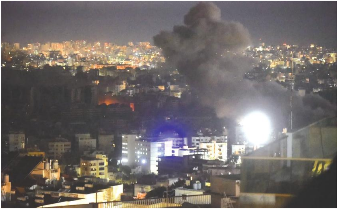
ഇസ്രയേൽ ഇറാനിൽ നടത്തിയ വ്യോമാക്രമണം

തന്റെ രാജ്യത്തിന്റെ എൺപതിരടി വലുപ്പവും പത്തിരടി ജനസംഖ്യയുമുള്ള ഇറാനെ ആക്രമിക്കാൻ തുനിഞ്ഞ നെതന്യാഹുവിന്റെ സാഹസികത ചോദ്യം ചെയ്യപ്പെടുന്നുണ്ട്. 16.50 ലക്ഷം ചതുരശ്രകിലോമീറ്റർ വിസ്തൃതിയിൽ ഇറാൻ വ്യാപിച്ചുകിടക്കുന്നോൾ, ഇസ്രയേലിന്റെ വിസ്തീർണം 22,145 ചതുരശ്രകിലോമീറ്റർമാത്രമാണ്. 9.61 കോടി ജനം ഇറാനിൽ അധിവസിക്കുന്നോൾ ഇസ്രയേലിന്റെ ജനസംഖ്യ 98 ലക്ഷമാത്രം. (യഹൂദരുടെ ലോകത്തെ ആകെ ജനസംഖ്യ 15.70 ദശലക്ഷമാണ്). സൈനികരുടെ എണ്ണത്തിലും ഈ അന്തരമുണ്ട്. 1.69 ലക്ഷം സൈനികരുള്ള ഇസ്രയേലിനു നേരിടേണ്ടത് 6.10 ലക്ഷം ഇറാനിയൻ സൈനികരാണ്. ഇസ്രയേലിന് 4.63 ലക്ഷം റിസർവ് സൈനികരുള്ളപ്പോൾ ഇറാന്റെ കരുതൽ സേനയിൽ 3.50 ലക്ഷം പേരേയുള്ളൂ. കവചിതവാഹനങ്ങളുടെ എണ്ണത്തിൽ ഇറാൻ മുൻപിൽ നിൽക്കുന്നോൾ (10,513, ഇസ്രയേൽ 2,200); പോർവിമാനങ്ങളിൽ ഇസ്രയേലാണു മുൻപിൽ (618). ഇറാൻ 551 യുദ്ധവിമാനങ്ങളേയുള്ളൂ.