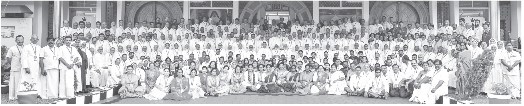
പാലായിൽ നടന്ന അഞ്ചാമത്ത് സീറോമലബാർസഭ മേജർ ആർക്കി എപ്പിസ്കോപ്പൽ അസംബ്ലിയിൽ പങ്കെടുത്ത പ്രതിനിധികൾ സമ്മേളനവേദിയായ അൽഫോൻസിൻ പാസ്റ്ററൽ ഇൻസ്റ്റിറ്റ്യൂട്ടിനുമുന്നിൽ.