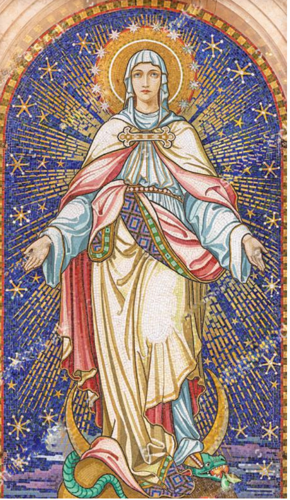
ധിക്കപ്പെട്ടു! ശാലീനയായ അവളുടെ ശിരസ്സിന് അലങ്കാരമായി ദൈവികപുണ്യങ്ങളാൽ വിളങ്ങുന്ന ഒരു രത്നഖചിതകീടവും അണിയിക്കപ്പെട്ടു!