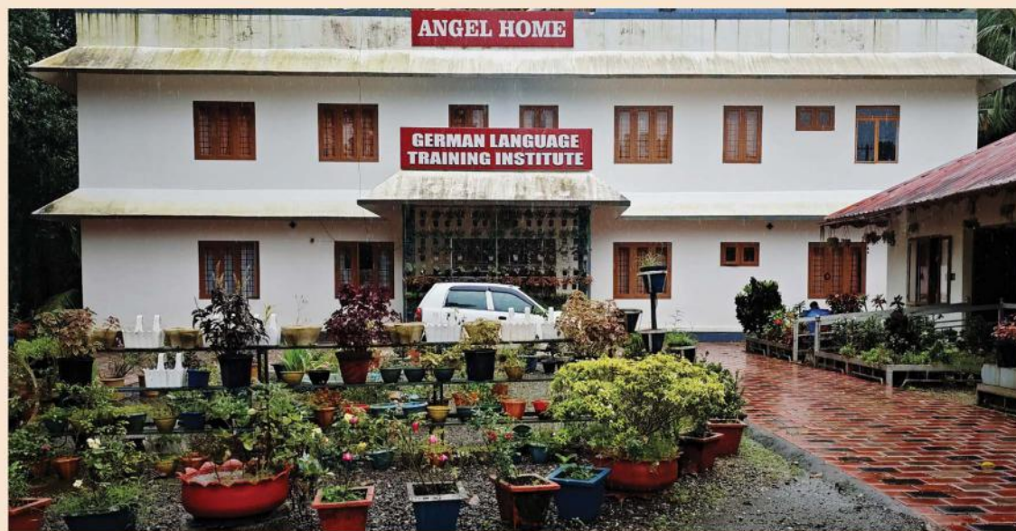
കടനാട് ഏയ്ഞ്ചൽ ജർമ്മൻ ലാംഗ്വേജ് ഇൻസ്റ്റിറ്റ്യൂട്ട്

വിശുദ്ധരുടെ തിരുശ്ലേഷിപ്പുകൾ പ്രതിഷ്ഠിച്ചുകൊണ്ടുള്ള ഒരു കൊച്ചുകപ്പലുണ്ട്. അതാണ് അച്ചന്റെ അടുത്ത സ്വപ്നം. അതിലേക്കായി 25-ൽപ്പരം വിശുദ്ധരുടെയും വാഴ്ത്തപ്പെട്ടവരുടെയും തിരുശ്ലേഷിപ്പുകൾ അച്ചൻ സംഘടിപ്പിച്ചുകഴിഞ്ഞു. Mob: 8281687443