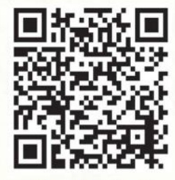
Handbook - 2