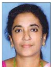
സിബി ജി. ടോ