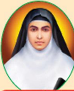
വിശുദ്ധ അൽഫോൻസാ (1910-1946)

ഫ്രാൻസിസ്കൻ ക്ലാരിസ്റ്റ് സന്യാസിനീസമൂഹം അൽഫോൻസാ പ്രൊവിൻസ്, പാലാ