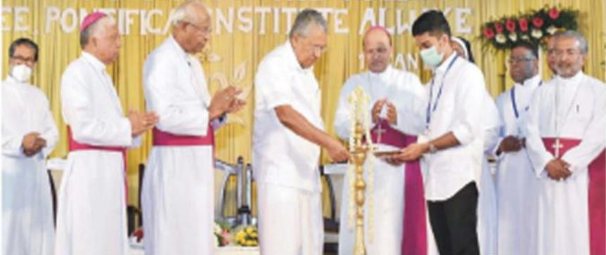
ആലുവ പൊന്തിഫിക്കൽ ഇൻസ്റ്റിറ്റ്യൂട്ട് ഫോർ തിയോളജി ആൻഡ് ഫിലോസഫിയുടെ സുവർണജൂബിലി സമാപനസമ്മേളനം കാർമ്മൽഗിരി പൊന്തിഫിക്കൽ ഇൻസ്റ്റിറ്റ്യൂട്ടിൽ ചേർന്നു.