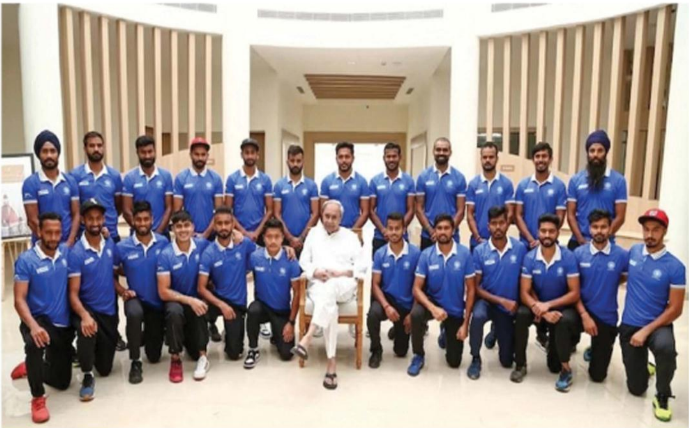
ഇന്ത്യൻ ഹോക്കി ടീം റിസ മുഖ്യമന്ത്രി നവീൻ പടനായികിനോടൊപ്പം

കൃത്രിമ ടർഫിന്റെ വേഗത്തിനൊത്ത് കളിവേഗം കൂട്ടിയ യൂറോപ്യൻ ടീമുകളും ഓസ്ട്രേലിയയും ന്യൂസിലൻഡുമൊക്കെ ഇത്തവണയും മികവു കാട്ടും. അവരുടെ ത്വരിതവേഗത്തിനൊപ്പം ഏതത്തോളം കൂതിക്കാനാകുമെന്നതിനെ ആശ്രയിച്ചിരിക്കും ഇന്ത്യയുടെ സാധ്യതകൾ. പുൾ ഘട്ടത്തിൽതന്നെ ഇംഗ്ലണ്ടും സ്വെഡിനും ഇന്ത്യയ്ക്കു കടുത്ത വെല്ലുവിളിയുയർത്തും. പാക്കിസ്ഥാൻ ഇല്ലാത്ത ലോകകപ്പിൽ ഏഷ്യയുടെ