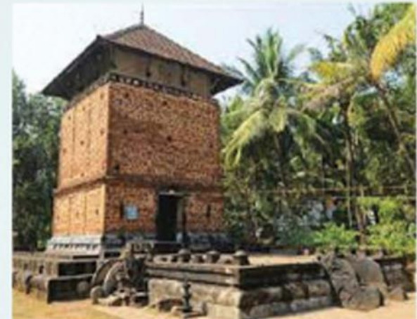
ഇന്ത്യയിലെ ആദ്യത്തെ മുസ്ലിം പള്ളിയാണ് കൊടുങ്ങല്ലൂരിലെ ചേരമാൻ ജുമാ മസ്ജിദ്. ഇന്ത്യയിൽ തന്നെ ജമ'അ നമസ്കാരം ആദ്യമായി നടന്ന പള്ളിയാണിത്. ക്രിസ്തുവർഷം 629 ലാണ് ഈ പള്ളി സ്ഥാപിക്കപ്പെട്ടത്. താഴെപ്പതി എ പി ഭൈ അബ്ദുൾ കലാം തന്റെ ഭരണകാലത്ത് ഇവിടം സന്ദർശിച്ചിരുന്നു. അറബ് നാട്ടിൽനിന്നു വന്ന മാലിക് ഇബ്നു ദിനാരാണ് ഇതു പണികഴിപ്പിച്ചതെന്ന് ഐതിഹ്യം. പുരാതന കേരളീയ വാസ്തുശില്പകലയുടെ ഉത്തമോദാഹരണമാണിത്.