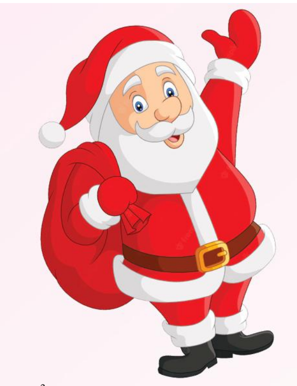
കാമുകിയെ കാണാനുള്ള അവസരം പ്രയോജനപ്പെടുത്തുക എന്ന ലക്ഷ്യത്തോടെയാണ് നായകൻ സാന്താക്ലോസായി വേഷം കെട്ടുന്നത്.

ഇത്തരം ചിത്രീകരണങ്ങളിലൂടെയെല്ലാം ക്രിസ്മസിന്റെ അന്തസ്സത്തതന്നെ ചോദ്യം ചെയ്യപ്പെടുകയും സാന്താക്ലോസ് വെറും കോമാളിക്കാരനായി മാറുകയും ചെയ്യുന്നു. ചുരുക്കത്തിൽ, ക്രിസ്മസ് പ്രതീകങ്ങളെ ലാഘവബുദ്ധിയോടെയോ അർത്ഥം മനസ്സിലാക്കാതെയോ ആണ് മലയാളസിനിമ സമീപിക്കുന്നത്. ക്രൈസ്തവരും കൗദാശികജീവിതവും കുരിശും വൈദികരും സന്യസ്തരുമെല്ലാം പരിഹാസദ്വേഷകരമായി ചിത്രീകരിക്കപ്പെടുകയും അവയെല്ലാം അവമതിക്കപ്പെടുകയും ചെയ്തുകൊണ്ടിരിക്കുമ്പോഴാണ് ലോകത്തിൽ ക്രിസ്മസിന്റെ ആഗമനം തന്നെ വിളിച്ചുപറയുന്ന ക്രിസ്മസുമായി ബന്ധപ്പെട്ടും ഇത്തരത്തിലുള്ള അപനിർമ്മിതികൾ സംഭവിച്ചുകൊണ്ടിരിക്കുന്നത്.