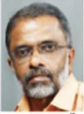
റോം ജോസ് ആഴ്വരകുന്ന്

റോഡപകടങ്ങൾ നമ്മെ ഞെട്ടിക്കാറുണ്ട്; പക്ഷേ, ഞെട്ടൽവിട്ടു നാം വളരെ വേഗം 'വന്ന വഴി'യിലേക്കു തന്നെ തിരിച്ചുപോകുന്നു. അപകടങ്ങൾക്കു പിറകെ നിയമങ്ങളും സടകുടഞ്ഞെഴുന്നേൽക്കുന്നു; സാവധാനം നിശ്ചിതമാകുന്നു. നിയമമെന്നതും ഭരണക്കാരെയും പൊതുപ്രവർത്തകരെയും ഇതൊന്നും ബാധിക്കാത്തതുപോലെ! എന്തുകൊണ്ടാണ് അപകടകാരണങ്ങളിലേക്ക് അന്വേഷണവും പഠനവും ഉണ്ടാകാത്തത്?