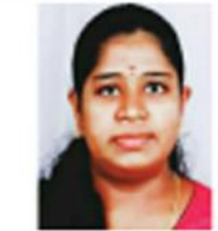
ഭാവന ആർ. എം.എ. സംഹിതയാനന്ദം ലേഖനം സർവകലാശാല, തിരുവനന്തപുരം