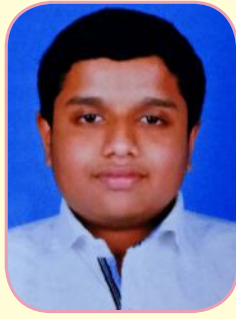
ലിയോ സ്റ്റീഫൻ മാനുവൽ സെന്റ് മേരീസ് എച്ച്.എസ്.എസ്., ഭരണങ്ങാനം രണ്ടാം സ്ഥാനം