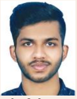
ആൽമിൻ കൊട്ടാരം സെന്റ് തോമസ് കോളജ് ഓഫ് ടീച്ചർ എജ്യൂക്കേഷൻ മൈലക്കോവ്

പ്രപഞ്ചമിങ്ങനെ ചടുലമായി മുന്നോട്ടുപോകുന്നത് ബന്ധങ്ങളുടെ കണ്ണികളാലാണ്. ആ കണ്ണികളാകട്ടെ വിശ്വാസത്തിൽ വേരൂന്നിയിരിക്കുന്നു. തന്റേതായ ഇടത്തിലേക്കു മറ്റൊരു വനെ അടുപ്പിക്കാനുള്ള തയ്യാറാവലാണു വിശ്വാസം. തന്റെ ശരീരം, മനസ്സ്, ആത്മാവ്, വികാരങ്ങൾ, അസ്വസ്ഥതകൾ, അനുഭവങ്ങൾ എന്നിവയുൾപ്പെടുന്ന ജീവിതപ്പുസ്തകത്തെ വായിക്കാനായി തുറക്കുന്ന താളുകളുടെ എണ്ണമാണു വിശ്വാസത്തിന്റെ അളവുകോൽ.