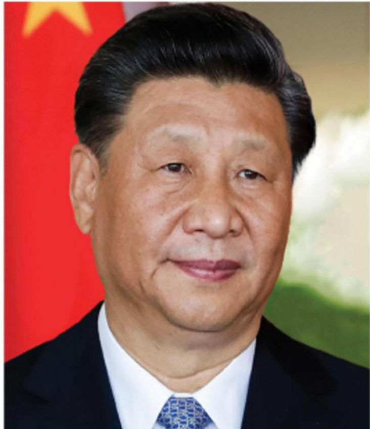
പേർ പീപ്പിൾസ് ലിബറേഷൻ ആർമിയുടെ ഭാഗമാണ്. 1927 ൽ രൂപവൽകരിച്ച പി എൽ എയുടെ സ്ഥാപകനും മാവോ സേതുങ്ങാണ്.