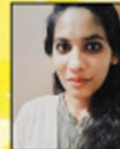
അബ്ബന എസ് മണി റബോഡൻ അക്കാദമി ഫോർ മെഡിക്കൽ കോഴിൻ, തോട്ടുപുഴ

റിസൾട്ടറിഞ്ഞപ്പോൾ എന്തെന്നില്ലാത്ത ആഹ്ലാദം അവളിൽ തിരമല്ല. താൻ എല്ലാ വിഷയത്തിലും മുഴുവൻ എ പ്ലസോടെ വിജയിച്ചിരിക്കുന്നു. അവൾ ഓടിച്ചെന്ന് ഈശോയുടെ തിരുസമ്പാദനത്തിനു മുന്നിൽ കമിഴ്ന്നുവീണു കരഞ്ഞു. താൻ ഇത്രയും നാൾ പഴിച്ച, തള്ളിക്കളഞ്ഞ ദൈവത്തോടു മാപ്പുപേക്ഷിച്ച് നന്ദി പറഞ്ഞ് ആ ദിവസത്തെ സൂര്യമോക്കി. ദൈവവുമായുള്ള ആ പഴയ ബന്ധത്തിന് ദൃഢത കൂട്ടി. അങ്ങനെ എഡ്വി തന്റെ മുമ്പിലുണ്ടായിരുന്ന പ്രതിബന്ധങ്ങളെയെല്ലാം തകർത്തൊന്നിത്തുകൊണ്ട് മുന്നോട്ടുകുതിച്ചു. ■