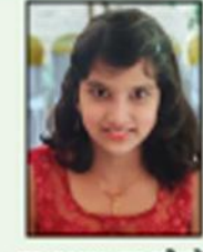
ആദായ അനീൽ ക്ലാസ് V, എ.ആർ.എസ്. ഭരണസമാഹാരം

മഴ എന്റെ സ്വപ്നമാണ് മഴ എന്റെ ദിനമാണ് മഴ എന്റെ നന്മയാണ് മഴ എന്റെ നാട്യമാണ് മഴ എന്റെ നടനമാണ് മഴ എന്റെ വാടിയിൽ തിളങ്ങിനിൽക്കും. ഒരു നറുപ്പുവായ് കുഞ്ഞുമക്കൾക്കു കണിയാകാൻ ദിനങ്ങൾ സുന്ദരമാക്കാൻ മനസ്സിനു കുളിർമയേകും ഒരു മനോഹര കുളിർക്കാറ്റായ് അമ്മയായ് മഴയെൻ മനസ്സിൽ നിറഞ്ഞുനിൽക്കും ചിലപ്പോൾ കണ്ണീർക്കടലായ് സന്തോഷം വാരി വിതറും പുഞ്ചിരിയൊട്ടായ് എൻ മനസ്സിലെ ഒരു വർണ്ണചിത്രമായ് മഴയെന്നും എൻ മുന്നിൽ നിറഞ്ഞുനിൽക്കും. ■