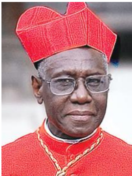
കർദ്ദിനാൾ റോബർട്ട് സറ

‘സത്യത്താൽ അവരെ വിശുദ്ധീകരിക്കണമേ’ എന്ന പ്രാർത്ഥനയോടൊപ്പം ‘നിന്റെ വചനമാണു സത്യം’ എന്ന് ഈശോ നാഥൻ അരുൾ ചെയ്യുന്നുണ്ട്. അതിനു വിശദീകരണമായി ബനഡിക്ട് മാർപാപ്പാ പറയുന്നത്, ദൈവവചനത്തിൽ, അതായത്, ‘ഞാനാകുന്നു സത്യം’ എന്നു പ്രഖ്യാപിച്ച ഈശോയിൽ നിമജ്ജനം ചെയ്ത് പവിത്രീകൃതനാകുന്നവനാണ് പൗരോഹിതൻ എന്നാണ്.