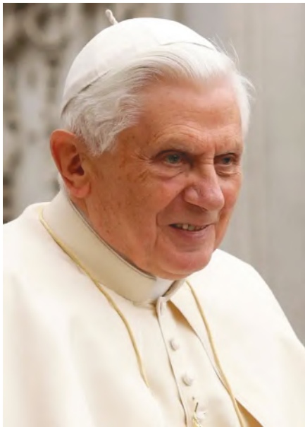
പരിശുദ്ധ ബനഡിക്ട് പതിനാറാമൻ പാപ്പ

“പിതാവേ, നിന്റെ വചനം സത്യമായതിനാൽ, ആ സത്യത്താൽ അവരെ പവിത്രീകരിക്കണമേ! നീ എന്നെ ലോകത്തിലേക്ക് അയച്ചതുപോലെ ഞാനും അവരെ ലോകത്തിലേക്ക് അയയ്ക്കുന്നു. അവരും സത്യത്താൽ വിശുദ്ധീകൃതരാകേണ്ടതിന് അവർക്കുവേണ്ടി എന്നെത്തന്നെ വിശുദ്ധീകരിക്കുന്നു” (യോഹ. 17: 17-19). 2009 ലെ പെസഹാവ്യാഴാഴ്ച മുറോൻ വെഞ്ചരിപ്പിന്റെ കുർബാനമധ്യേ പരിശുദ്ധ ബനഡിക്ട് പതിനാറാമൻ പാപ്പായുടെ പ്രസംഗത്തിനായാറം ഈ തിരുവചനഭാഗമായിരുന്നു.