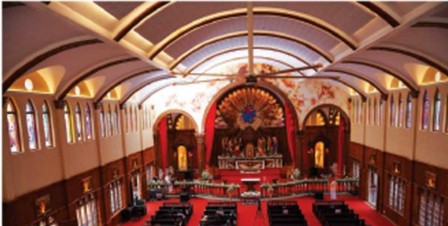
പള്ളിയുടെ ഉൾവശം : മുകൾനിലയിൽ ഗ്രാസ്സിൽ 64 വിശുദ്ധരുടെ രൂപങ്ങൾ ചിത്രീകരിച്ചിരിക്കുന്നു.

തലക്കെട്ടായി ചിത്രീകരിച്ചിരിക്കുന്ന ഇലകൾ. അബ്രാഹത്തിന്റെ ബലിപീഠത്തിലെ കാട്ടുവളളികളെയും കൽക്കെട്ടിനെയും അനുസ്മരിപ്പിക്കുന്നതാണ് പ്രധാന ബലിപീഠത്തിലെ കൊത്തുപണികൾ. പള്ളിയുടെ മുകൾനിലയിൽ ഗ്രാസ്സിൽ ആലേഖനം ചെയ്ത 64 വിശുദ്ധരുടെ രൂപങ്ങൾ ഈ പള്ളിയുടെ ശില്പപരംഗിക്ക് ചാരുത വർദ്ധിപ്പിക്കുന്നു. കൂടാതെ, പള്ളിയുടെ കിഴക്കുവശത്തു റെസ്റ്റിന്റേഡ് ഗ്രാസിൽ ചെയ്തിരിക്കുന്ന 20 അടി പൊക്കവും 15 അടി വീതിയുമുള്ള പെന്താക്കൂസ്തായുടെ രൂപം ഒരു ദൃശ്യവിസ്മയമാണ്. പള്ളി മണി ഇംഗ്ലണ്ടിലെ യോർക്ക്ഷെയറിൽനിന്ന് ഇറക്കുമതി ചെയ്ത 900 കിലോ ഭാരമുള്ള കൂറ്റൻ മണിയാണ്. 360 ഡിഗ്രിയിൽ കറങ്ങിയിടിക്കുന്ന മണി ലോകപ്രശസ്ത മണിനിർമ്മാതാക്കളായ വാർണർ ബ്രദേഴ്സിന്റെ നിർമ്മാണവൈദവ്യത്തിൽപ്പെട്ടതാണ്.