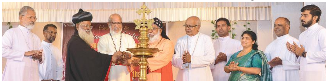
വടവാതുർ സെന്റ് തോമസ് അപ്പസ്തോലിക് സെമിനാരിയുടെയും പൗരസ്ത്യ വിദ്യാപീഠത്തിന്റെയും ജൂബിലി ആഘോഷങ്ങളുടെ സമാപനസമ്മേളനത്തിന്റെ ഉദ്ഘാടനച്ചടങ്ങിൽ സീറോ മലബാർ സഭ മേജർ ആർച്ചുബിഷപ്പ് കർദ്ദിനാൾ മാർ ജോർജ് ആലഞ്ചേരി, മലങ്കര ഓർത്തഡോക്സ് സഭാ കാതോലിക്ക ബസേലിയോസ് മാർത്തോമാ മാത്യൂസ് ത്രിതീയൻ ബാവ, സീറോ മലങ്കര സഭാ മേജർ ആർച്ചുബിഷപ്പ് കർദ്ദിനാൾ മാർ ബസേലിയോസ് ക്ലീമിസ് കാതോലിക്കാ ബാവ എന്നിവർ ചേർന്ന് നിലവിലുള്ള തെളിക്കുന്നു.

കോട്ടയം: പൗരോഹിത്യപഠനത്തിലും പരിശീലനത്തിലും വടവാതുർ സെന്റ് തോമസ് അപ്പസ്തോലിക് സെമിനാരി ലോകോത്തര മാതൃകയാണെന്ന് സീറോ മലബാർ സഭ മേജർ ആർച്ചുബിഷപ്പ് കർദ്ദിനാൾ മാർ ജോർജ് ആലഞ്ചേരി. സെമിനാരിയുടെ ഡയമണ്ട് ജൂബിലി സമാപനവും വിദ്യാപീഠത്തിന്റെ 75-ാം ജൂബിലി സമാപനവും ഉദ്ഘാടനം ചെയ്യുകയായിരുന്നു കർദ്ദിനാൾ. ആത്മീയവും സാമൂഹികവും ബൗദ്ധികവുമായ എല്ലാ തലങ്ങളിലും സഭയ്ക്ക് ഉത്തേജനം നൽകാൻ സെമിനാരിയെ കഴിഞ്ഞിട്ടുണ്ട്. വൈദികർക്കു മാത്രമല്ല അല്പായുധർക്കും വിവിധ സന്യാസതസമൂഹങ്ങൾക്കും ദൈവശാസ്ത്രപരമായ പഠനത്തിന് ഈ സ്ഥാപനം പ്രാമുഖ്യം നൽകിവരുന്നു. സഭയുടെ പ്രേഷി