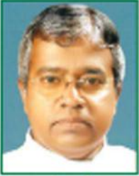
ഫ. മാത്യു മാത്യു മിഷൻ

ചെമ്മലമറ്റം തുടവകയിലെ പന്ത്രണ്ടു ശ്ലീഹന്മാരുടെ പുതിയ ദൈവാലയം 2022 ജൂൺ രണ്ടാം തീയതി കൂദാശ ചെയ്യപ്പെട്ടു. 2020 ജനുവരി 26 ന് ശിലാസ്ഥാപനം നടത്തി ജൂൺ രണ്ടിനാടംഭിച്ച നിർമ്മാണപ്രവർത്തനങ്ങൾ ദൈവത്തിന്റെ പ്രത്യേക പരിപാലന യാലും തുടവകമധ്യസ്ഥനായ 12 ശ്ലീഹന്മാരുടെ മദ്ധ്യസ്ഥ്യത്താലും തുടവകജനത്തിന്റെയും ഗുണകാംക്ഷികളുടെയും സഹായസഹകരണത്താലും രണ്ടു വർഷംകൊണ്ടു പൂർത്തിയാക്കാൻ കഴിഞ്ഞു. 12 ശ്ലീഹന്മാരുടെ നാമത്തിലുള്ള ഇന്ത്യയിലെ ഏറ്റവും വലിയ ദൈവാലയമാണ് ഇവിടെ നിർമ്മിച്ചിരിക്കുന്നത്.