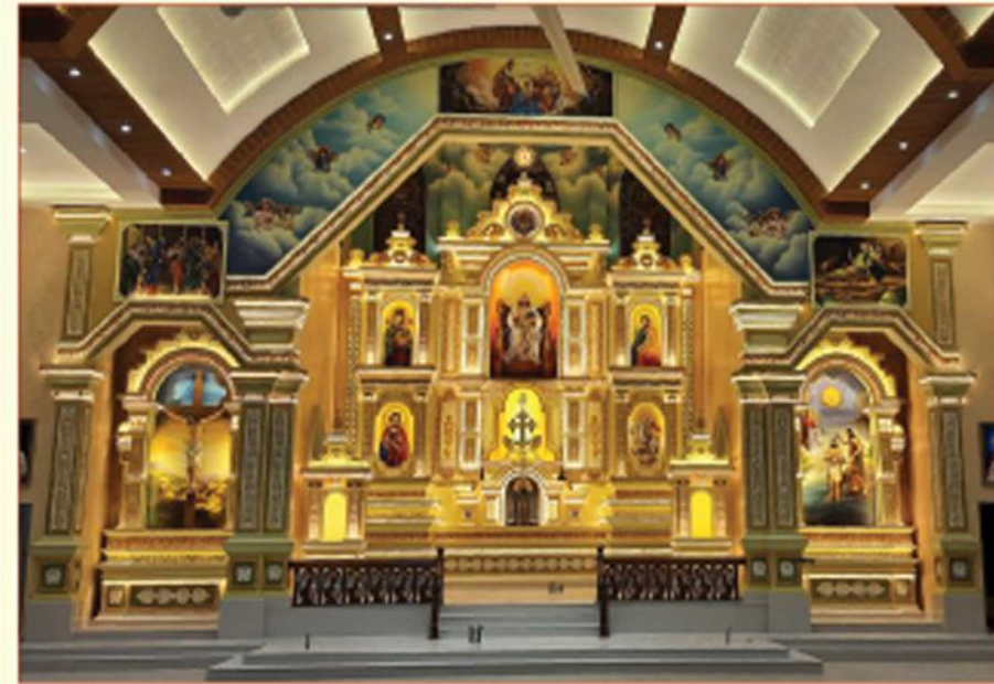
പൗരസ്ത്യ സുറിയാനിരീതിയിലുള്ള അൾത്താര

അൾത്താരയുടെ ഇടതുവശത്തായി ക്രൂശിതരൂപവും വലതുവശത്തായി യേശുവിന്റെ ജ്ഞാനസ്നാനവും ചിത്രീകരിച്ചിരിക്കുന്നു. അന്ത്യത്താഴം, പെന്തക്കൂസ്ത, സ്വർഗ്ഗാണി എന്നീ കാൽവാസ് പെയിന്റിങ്ങുകൾ ദൈവാലയത്തെ മനോഹരമാക്കുന്നു. ഈശോയുടെ ജനനംമുതൽ സ്വർഗാരോഹണംവരെയുള്ള സംഭവങ്ങൾ ഗ്ലാസ് പെയിന്റിങ്ങിൽ ആലേഖനം ചെയ്തിട്ടുണ്ട്. പള്ളിയുടെ മുമ്പിൽ ക്രിസ്തുരാജന്റെ അതികായരൂപം സ്ഥാപിച്ചിരിക്കുന്നു. പിന്നിൽ വിശുദ്ധ ഗീവർഗീസ് സഹദായുടെയും ഇരുവശങ്ങളിലുമായി മാതാവിന്റെയും മാർ യൗസേപ്പിതാവിന്റെയും രൂപങ്ങളുമുണ്ട്. ഇതു കൂടാതെ കൽക്കുരിശ്, കൊടിമരം, മണിമാളിക, പള്ളിയുടെ മുമ്പിലുള്ള നടയുടെ സമീപത്തായി പിയാത്ത, ഭഗോട്ടോ എന്നിവയും ദൈവാലയത്തെ മനോഹരമാക്കുന്നു. കല്ലിൽ തീർത്ത 40000 ചതുരശ്രയടി കെട്ടും പശ്ചാത്തലവുമാണുള്ളത്.