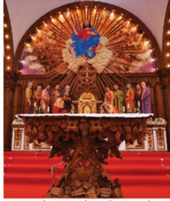
പന്ത്രണ്ടു ശ്ലീഹന്മാരുടെ നിരസാന്നിദ്ധ്യമായ അർത്താര

ദൈവികപദ്ധതിക്കൊപ്പം നല്ല സമരായന്റെ ചൈതന്യവും നടപ്പാക്കുകയാണ് ചെമ്മലമറ്റം പള്ളി. ദൈവാലയവെണ്ണപ്പെട്ടി നോടനുബന്ധിച്ച് 12 ശ്ലീഹന്മാരെ അനുസ്മരിച്ചുകൊണ്ട് 12 ലക്ഷം രൂപ പാനം, വിവാഹം, വേനനിർമ്മാണം എന്നിവയ്ക്കു സഹായമായി നൽകുന്നു. ഈ പദ്ധതിക്ക് എ.കെ.സി.സി. സംഘടന നേതൃത്വം കൊടുക്കും. കൂടാതെ, ഒരു വ്യക്തി സംഭാവനയായി നൽകിയ 25 ലക്ഷം രൂപയ്ക്കൊപ്പം 25 ലക്ഷം രൂപകൂടി കണ്ടെത്തി 50 ലക്ഷം രൂപയ്ക്ക് 10 വീടുകൾ നിർമ്മിച്ച് ഭവനരഹിതർക്കു നൽകുന്ന പദ്ധതിക്ക് വിൻസെന്റ് ഡി പോൾ സൊസൈറ്റി നേതൃത്വം നൽകും.