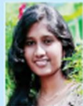
ബാങ്ക് കോച്ചിംഗ് PT College, Ettumanoor