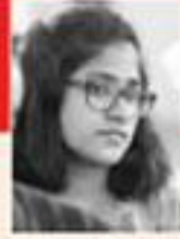
അമൃത സീതം എ. എം.എ. മാതൃകാവിദ്യാലയം, മലപ്പുറം, തൃശ്ശൂർ.

മലയാളവാചാഭിസാഹിത്യത്തിലെ വളരെ പ്രധാനപ്പെട്ട ഒരു ശാഖയാണ് കടങ്കഥകൾ. നിത്യജീവിതത്തിലെ കൊച്ചുകൊച്ചു സംഭവങ്ങളും ഗൃഹപാഠങ്ങളും കൃത്യതയോടെയാണ് കടങ്കഥയുടെ അടിസ്ഥാനം. കടങ്കഥയിൽ രണ്ടു പേർ പങ്കാളികളാകുന്നു. ചോദ്യം ചോദിക്കുന്നയാളും ഉത്തരം നൽകുന്നയാളും. വാചാഭിസാഹിത്യത്തിലെ വിനോദമാണിത്. വസ്തുത മറച്ചുപിടിച്ചു ചോദ്യമുന്നയിക്കുകയും അതിൽനിന്നു വസ്തുത കണ്ടെത്തുകയുമാണ് ഇതിന്റെ രീതി. ഉത്തരം പറയാതെ വന്നാൽ തോൽക്കുന്നയാൾ കടത്തിലാവുന്നു. അതിനാലാവാം ഈ നാടോടിവാക്ക്മയരൂപത്തിന് 'കടങ്കഥ' എന്നു പേരുവന്നത്.