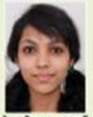
ആൻ മൈ രോമൻ ഇന്റർ വൺ സെന്റ് മേരീസ് എച്ച്.എസ്.എസ്. പാലം

ഒരു അലഞ്ഞാൽ പറഞ്ഞു വച്ച മനോഹരമായ ആ വാചകം ഓർമ്മയിൽ തെളിയുന്നു. "ഞാൻ മനിച്ചപ്പോൾ എന്തെ കൈയിലേറ്റാൻ എന്റെയും ഒരു സ്ത്രീയുണ്ടായി - എന്റെ അമ്മ. ഞാൻ വളർന്നുകൊണ്ടിരിക്കുമ്പോൾ എന്റെയും കളിക്കാൻ ഒരു സ്ത്രീ - എന്റെ ചെങ്ങൽ. ഞാൻ സ്കൂളിൽ പോയിത്തുടങ്ങിയപ്പോൾ എന്റെ പാതയിൽ സഹായിക്കാൻ മറ്റൊരു സ്ത്രീ - എന്റെ അമ്മയും പി.ക. പിന്നീട് എനിക്കു സ്നേഹിക്കാനും കരാപിടിക്കാനും അനുയോജ്യമായ മറ്റൊരു സ്ത്രീ - എന്റെ ഭാര്യ. അവസാനം ഞാൻ മരിക്കുമ്പോൾ എന്നെ പൂർണ്ണമായി ഏറ്റെടുക്കാൻ പ്രാപ്തിയുള്ള ആ സ്ത്രീ - എന്റെ മാതൃഭൂമി. പ്രിയപ്പെട്ടവരേ, നിങ്ങളും ഒരു സ്ത്രീയാണെങ്കിൽ തീർച്ചയായും അഭിമാനിക്കൂ." എത്ര അർത്ഥവത്തായ വാചകങ്ങളാണല്ലോ! എന്നാൽ, ഏറ്റവുമധികം ബഹുമാനിക്കപ്പെടേണ്ട ഈ സമൂഹം അർഹമായ വേദനകളെടുക്കുന്നുണ്ടോ എന്നതു സംശയമാണ്. ശരിയാണ്, അവർ തങ്ങളുടെ കഴിവു തെളിയിക്കാത്ത മേഖലകളില്ല. പക്ഷേ, അത്രയേതെങ്കിലും മേഖലകളെ പഠനത്തുനവരുടെ എണ്ണം വിരളമാണല്ലോ. കാലങ്ങളായി നാം പഠിച്ച ചെമ്പതു കൊണ്ടിരിക്കുന്ന ഒരു വിഷയമാണ്