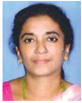
സിബി ജെ ടോ

കെഎസ്ആർടിസി ഒരു മലയാളിയെ സംബന്ധിച്ചിടത്തോളം വെറുമൊരു വാഹനസർവീസല്ല, അവന്റെ നിത്യജീവിതവുമായി ഇഴുകിച്ചേർന്നതാണ്. സിനിമയിലും, സാഹിത്യത്തിലും ഉൾപ്പെടെ നമ്മുടെ സാംസ്കാരികജീവിതത്തിൽ ഈ പൊതുഗതാഗതസംവിധാനത്തിന്റെ ഓർമ്മപ്പെട്ടുകൾ തെളിഞ്ഞു കിടക്കുന്നു.