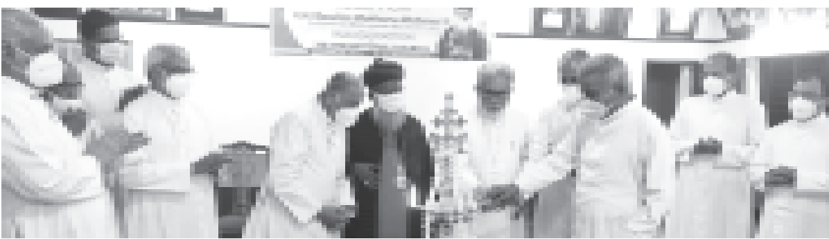
പാലാ രൂപത പതിമൂന്നാമത് പ്രസ്ബിറ്ററൽ കൗൺസിൽ സമ്മേളനം മലങ്കര ഓർത്തഡോക്സ് സഭാതലവൻ പരിശുദ്ധ ബസേലിയോസ് മാർത്തോമ്മ മാത്യൂസ് തൃതീയൻ കാതോലിക്കാ ബാവ ഉദ്ഘാടനം ചെയ്യുന്നു.