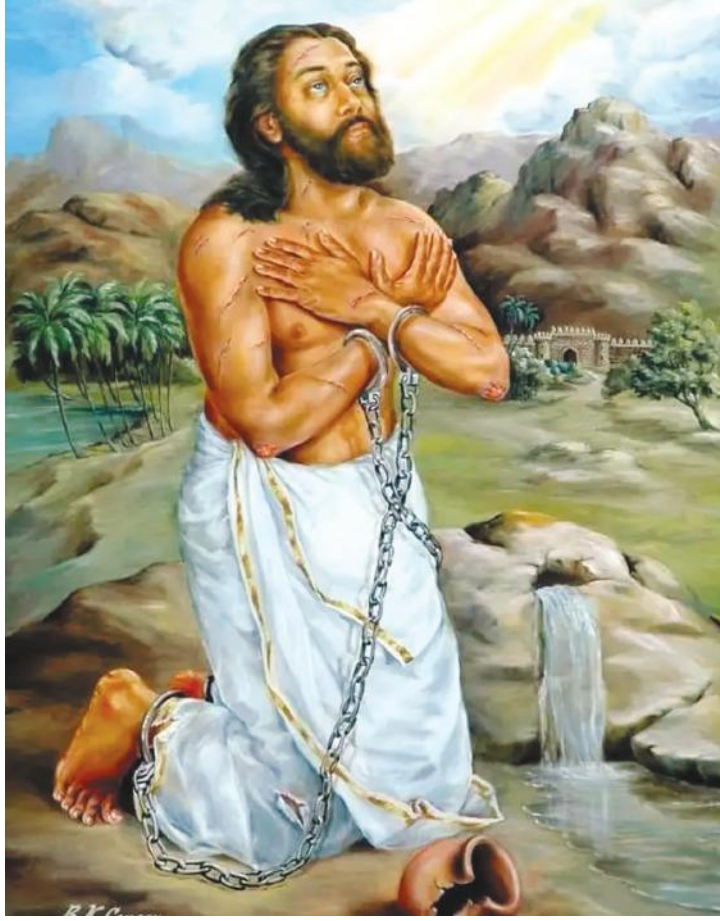
നാണ് 'ലാസർ' എന്നർത്ഥം വരുന്ന 'ദേവസഹായം' പിള്ള എന്ന പേരിൽ അദ്ദേഹം മാമ്മോദീസ സ്വീകരിച്ചത്. തിരുവിതാംകൂറിന്റെ പല ഭാഗങ്ങളിൽ സുവിശേഷം പ്രസംഗിച്ച ദേവസഹായംപിള്ള രാജസേവകരുടെ കണ്ണിലെ കരടായി മാറി. പിള്ളയ്ക്കെതിരെ അവർ രാജ്യദ്രോഹക്കുറ്റം ചുമത്തി ജയിലിലടച്ചു.

തിരുവിതാംകൂറിൽ മിഷണറിയായിരുന്ന ഈശോസഭാദൈവദികനിൽനിന്ന് 1745 മേയ് 17