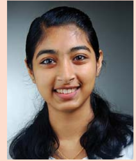
ബെല്ല സണ്ണി ദേവമാതാ കോളജ്, കുറവിലങ്ങാട്

ണം. മുകളിൽ നിൽക്കണം എന്നതിലുപരി ജനത്തോടൊപ്പം നിൽക്കണം എന്നതായിരിക്കണം അവരുടെ ലക്ഷ്യം. ഇങ്ങനെയുള്ള വരകണ്ടെത്തലാണ് പൗരനെന്ന നിലയിൽ നാമോരോരുത്തരുടെയും ഉത്തരവാദിത്വം. സേവനമെന്ന തീരങ്ങളിൽ കെടാതെ കാക്കുന്നവരാണ് നമുക്കാവശ്യം. ജനക്ഷേമത്തിനുവേണ്ടി വിദ്യാഭ്യാസവനരായ, നാട്ടുകാരെയും നാടിനെയും മാനിക്കുന്ന ജനപ്രതിനിധികളെ നമുക്കു തിരഞ്ഞെടുക്കാം.