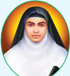
വിശുദ്ധ അൽഫോൻസാ (1910 - 1946)

ഫ്രാൻസിസ്കൻ ക്ലാരിസ്സ് സന്യാസിനീസമൂഹം അൽഫോൻസാ പ്രൊവിൻസ്, പാലാ